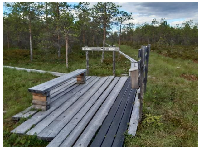
Pitkospuureitillä on useita levähdyspaikkoja sekä tauluja linnuista, kasveista ja historiasta