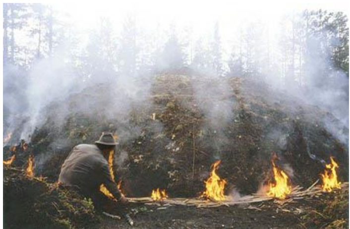
Nevalla on hyvin säilyneitä tervahautoja

Koordinaatit WGS84: 62° 49' 4,284" / 22° 52' 19,719"