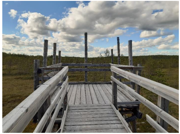
Valtatieltä 700 metrin päässä on esteetön lintulava