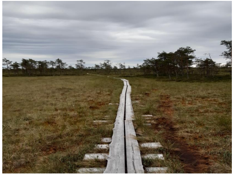
Lintulavalta johtavat komposiittipitkospuut ja lehtikuusipitkospuut Lehtisalons laavulle