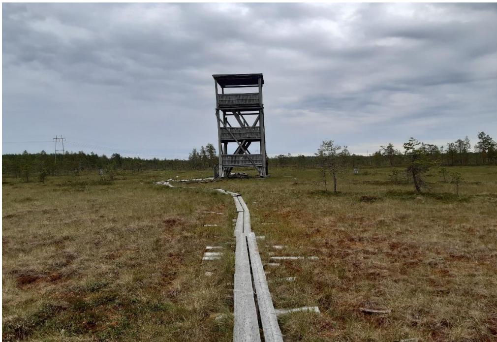
Lehtisalon laavulta pitkospuut johtavat lintutornille, johon on matkaa 2.4 km

Koordinaatit WGS84: 62° 50' 12,963" / 22° 50' 32,388"