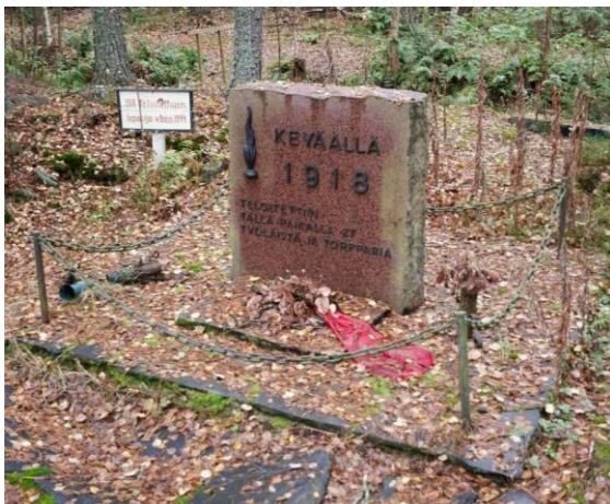
Vuoden 1918 teloitettujen muistomerkki

Koordinaatit WGS84: 62° 49' 54,666" / 22° 52' 47,182"