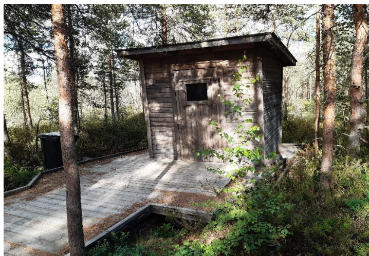
Lähdössä esteettömät pitkospuut (lankkupolku) sekä esteetön WC