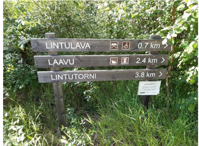
Lähtöpaikka pysäköintialueelta valtatie 18